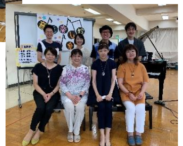
令和4年度 同窓会第20回 保育研修会