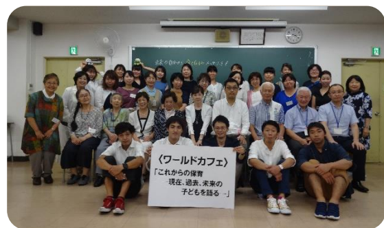
令和元年度 同窓会第19回保育研修会